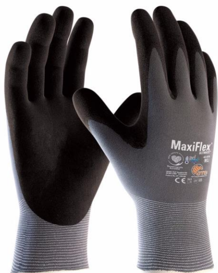
～世界初の制汗テクノロジー採用～ 「MaxiFlex® ULTIMATE™ 42-874」 標準価格：840円（税別）

全28種の手袋の中でも販売の主力となるのが、 世界初の制汗テクノロジーを採用することで発汗減少率31%を実現 した「MaxiFlex®（マキシフレックス）ULTIMATE™」です。