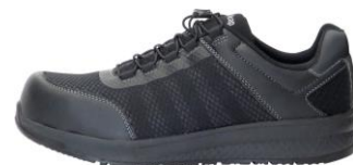
非売品限定カラー（オールブラック）

ミドリ安全フットウエア公式Facebookページに「いいね！」をしてコメントいただいた方の中から抽選で10名様に、非売品のQL-01限定カラー（オールブラック）をプレゼントいたします。