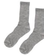
ベルデソックスeks (エクス)