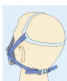
しめひも タイプ RB